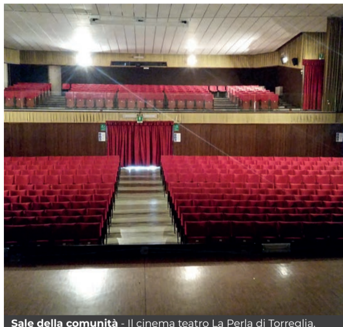
Sale della comunità - Il cinema teatro La Perla di Torreglia.

esercenti cinema Triveneta per le Sale della comunità – è in continua ascesa dal post Covid. Ecco alcune proposte. A Padova, al Cinema teatro ai Colli si possono acquistare abbonamenti a 10 proiezioni a 44 euro. Al Rex il costo è 40 euro, simili proposte anche all' Esperia . Al Cinema Italia di Dolo gli abbonamenti, senza scadenza, sono a 5 o 10 proiezioni (27,50 e 55 euro,