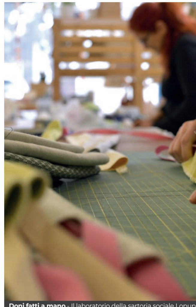
Doni fatti a mano - Il laboratorio della sartoria sociale Lopup

Un regalo "vivo"? A Saonara in via Ugo Foscolo 23/a si trova il punto vendita e fioreria