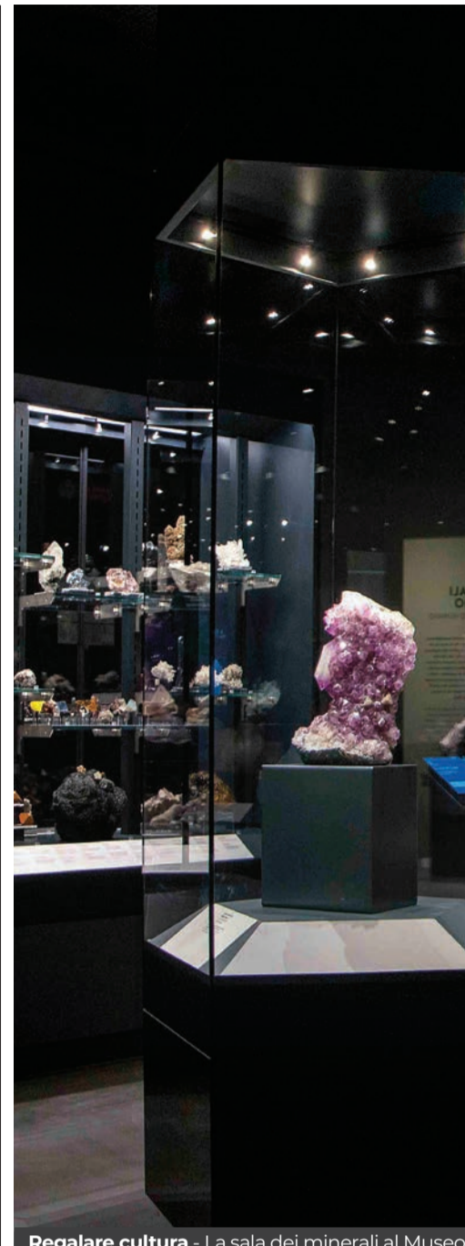
Regalare cultura - La sala dei minerali al Museo

E l' Università di Padova ? La sua offerta espositiva è cresciuta negli ultimi anni con perle di