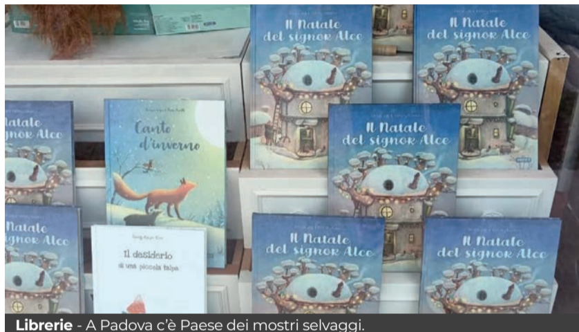
Librerie - A Padova c'è Paese dei mostri selvaggi.

Per i più grandi? «Perché non pensare a un classico, come Momo di Michael Ende o Il giardino segreto di Frances H. Burnett?», conclude la librai.