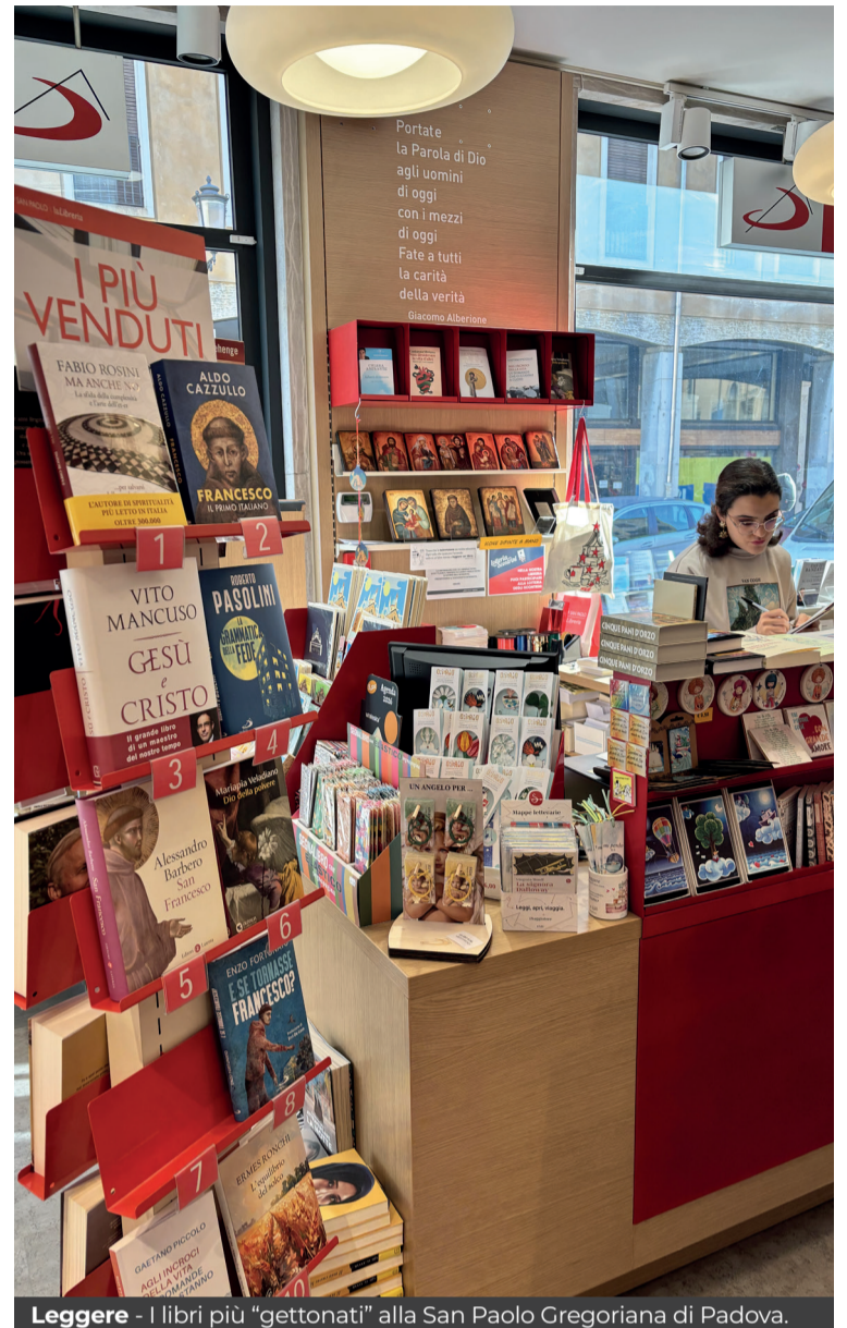
Leggere - I libri più "gettonati" alla San Paolo Gregoriana di Padova.

Leggera ma intensa è invece la "favola" scritta dal card. Matteo