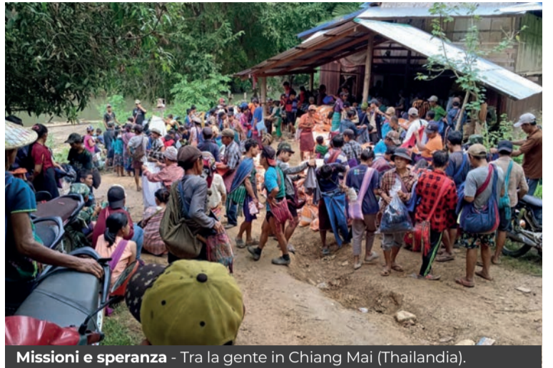
Missioni e speranza - Tra la gente in Chiang Mai (Thailandia).

U n gesto di speranza verso i più poveri del mondo? Lo si può fare sostenendo i missionari, in particolare i fidei donum della Diocesi padovana, ad esempio, che operano in tre continenti. Ecco alcuni progetti che si possono sostenere ( www.centromissionario.diocesipadova.it ).