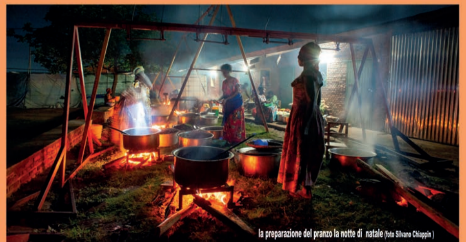
la preparazione del pranzo la notte di Natale

Cassa Rurale Alto Garda Rovereto CREDITO COOPERATIVO DAL 1892