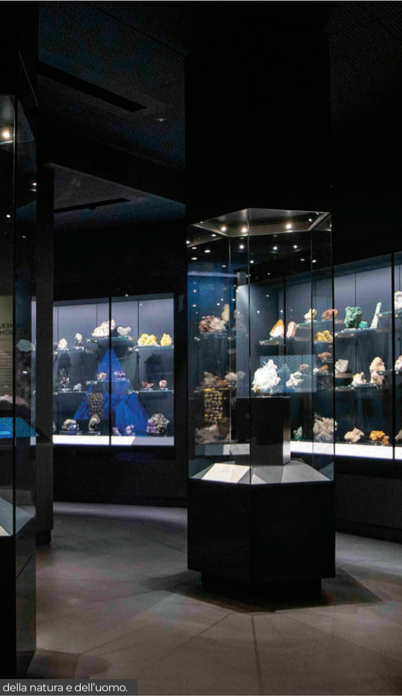
della natura e dell'uomo.

valore assoluto, che si aprono sempre di più al territorio. propone anch'essa una sorta di gift card , ovvero un "biglietto integrato" per l'accesso a tre dei suoi siti principali, il Museo della natura e dell'uomo , il Palazzo del Bo e l' Orto botanico . È valido per due adulti e fino a 3 minori, costa 55 euro e ha validità di 6 mesi dalla data di emissione. Per un solo singolo adulto il biglietto costa invece 25 euro. Chi preferisce può visitare solo due o un solo sito. I minori fino a 6 anni entrano comunque gratis così come quelli fino ai 12 anni se con un adulto. Anche al Museo nazionale Atestino di Este i minorenni entrano gratis, due adulti con minori al seguito pagano 4 euro cadauno invece di 5. Al Museo di cava Bomba (Cinto Euganeo) si possono acquistare biglietti d'ingresso validi fino al 31 dicembre 2026 abbinati a buste con cartoncino realizzati a mano.