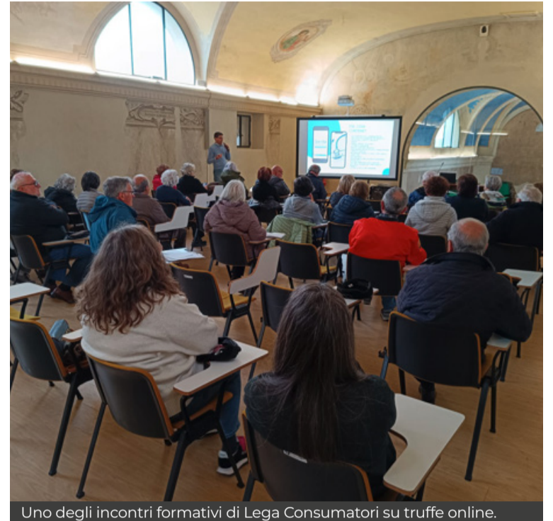
Uno degli incontri formativi di Lega Consumatori su truffe online.